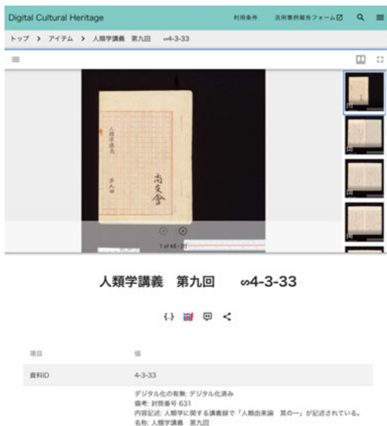
図4 アイテム詳細画面

具体的には、Node.js が動作するサーバが必要となる。選択肢としては、さくらのクラウドや AWS (Amazon Web Services) といった商用サービスの利用が考えられる。または、大学・研究機関で共創する産学官連携のためのデータプラットフォームである mdx 12 などの利用が挙げられる。これらはビルド時にのみサーバを起動する形をとることで、コストを抑える他、セキュリティリスクの軽減をはかる。