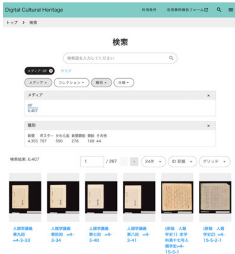
図3 キーワード検索